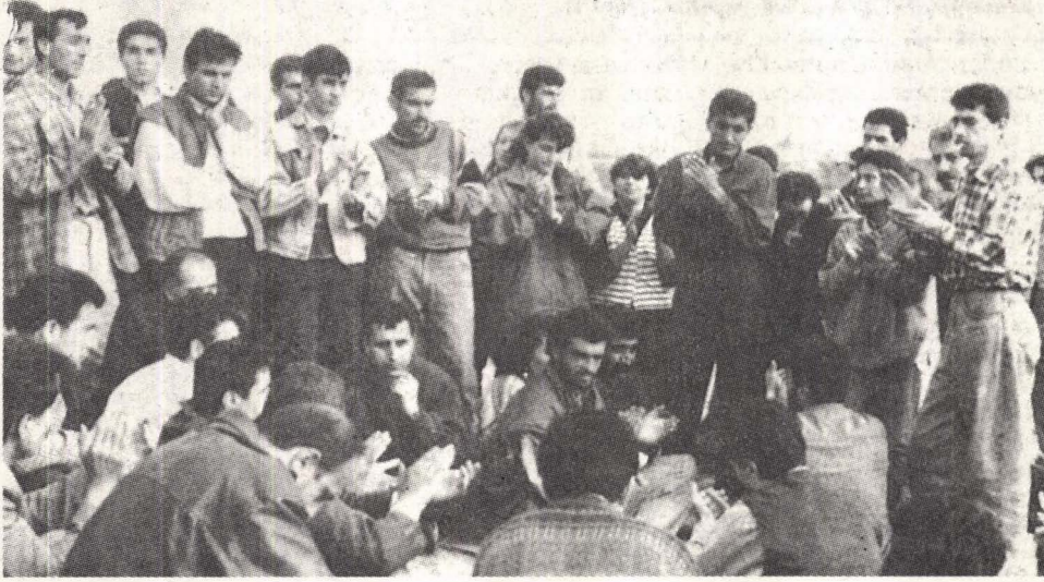
Aras Kargo direnişçilerinin Cemtaş ziyareti...

T oplu sözleşmenin imzalanmasının hemen sonrasında Pendik belediyesinde çalışan 200'ü aşkın işçi işten atıldı, 600'ünün de tensikat listesinde olduğu yayıldı. Buna Pendik işçilerinin ilk yanıtı işçerin işgali oldu. Daha sonra işgal eylemi kırıldı ve direniş işyeri önünde sürdürülmeye başlandı. Pendik Belediyesi işçileri bundan önce de daha küçük çaplı tensikat saldırıları ile yüzyüze kalmış ve toplu vize, iş bırakma vb. kitlesel eylemlerle saldırıya uğramıştı. Bugün bu haklı direnişin başarıya ulaşması ise, ancak, KAGIT-HANE, ARAS KARGO, GEBZE VB. geçmiş direniş deneyimlerinin olumlu-olumsuz derslerinin bilince çıkarılması ile mümkün olacaktır. Nedir bu dersler?