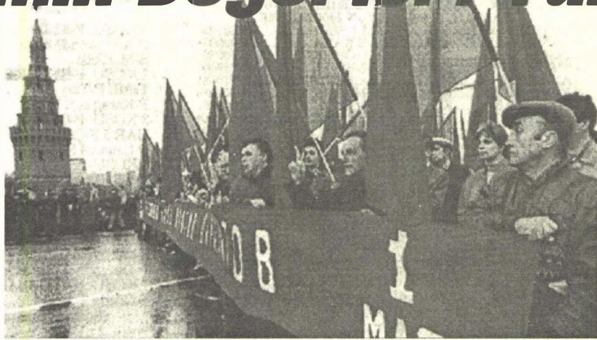
1 Mayıs '96: Tüm dünyada sosyalizmin değerleri yükselişe geçti.