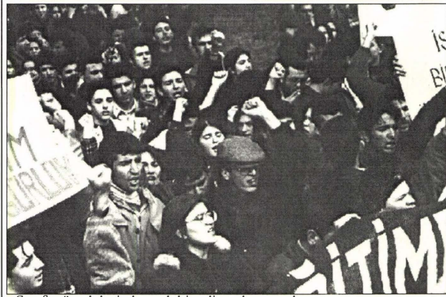
Sınıf mücadelesi alanındaki gelişmeler; emek-sermaye çatışmasının sertleşmesi, Kürt ulusal mücadelesinin ulaştığı düzey, işçi hareketinin canlanması, tüm bunlar sonuçta öğrenci gençliğe de az-çok yansıtacaktır. Öyle de oldu...

Mevcut olumlu-olumsuz koşulları ve dinamikleri doğru bir biçimde tahlil eden komünist hareket, sürecin izleyeceği seyri de doğru bir biçimde ortaya koydu. Sınıf mücadelesi sertleştiği için bunların yankıları er ya da geç gençlik kitlesine de ulaşacaktır.