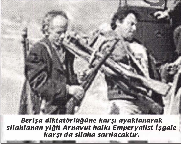
Berişa diktatörlüğüne karşı ayaklanarak silahlanan yiğit Arnavut halkı Emperyalist işgale karşı da silaha sarılacaktır.

Söz konusu olan soygun ve talandan pay kapma olduğunda birbiriyle kıyasıyla yarışan emperyalist güçler, ezilen emekçi halkların her devrimci çıkışı karşısında her zaman birleşmişlerdir. Aynı kader ve çıkar birliği kapitalist ülke burjuvazileri açısından da geçerlidir. Bunun en güncel