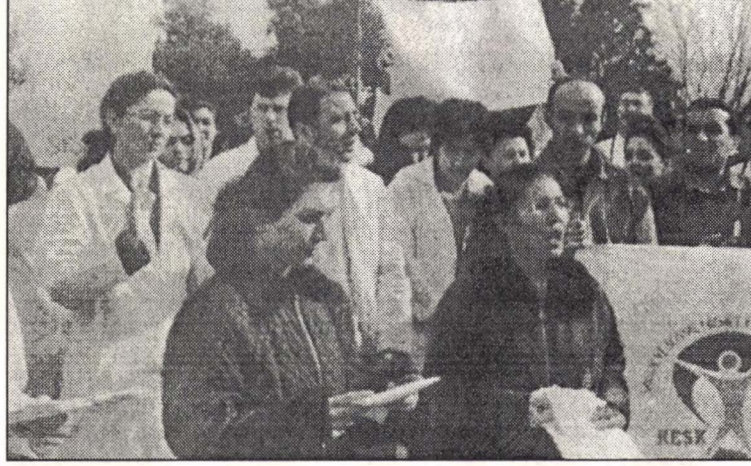
ATO, İHD Ankara Şube, Çağdaş Hekimler Derneği ve ÇHD tarafından bir basın açıklaması düzenlendi.

Bu saldırıya karşı 20 Nisan günü, SES Ankara Şube,