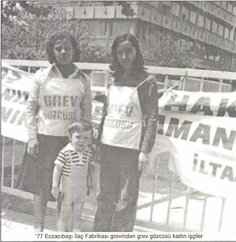
*77 Eczacıbaşı İlaç Fabrikası grevinden grev gözçüsü kadın işçiler

Partimizin programı kadın sorununu sınıfsal bir bakış açısıyla en özlü bir biçimde formüle etmiştir. Sorunun proletarya devrimi yoluyla sosyalizm koşullarındaki temelli ve biricik olanaklı çözümünü sunmakla kalmamış, bugünden “Toplumsal hayatın tüm alanlarında kadın-erkek eşitliği!” istemi ve şiarı altında güncel bir mücadele çağrısı da ortaya koymuştur ( Acil Demokratik ve Sosyal İstемler/VI. Bölüm/D maddesi istemleri, s. 48 ). Yanısıra “Emeğin