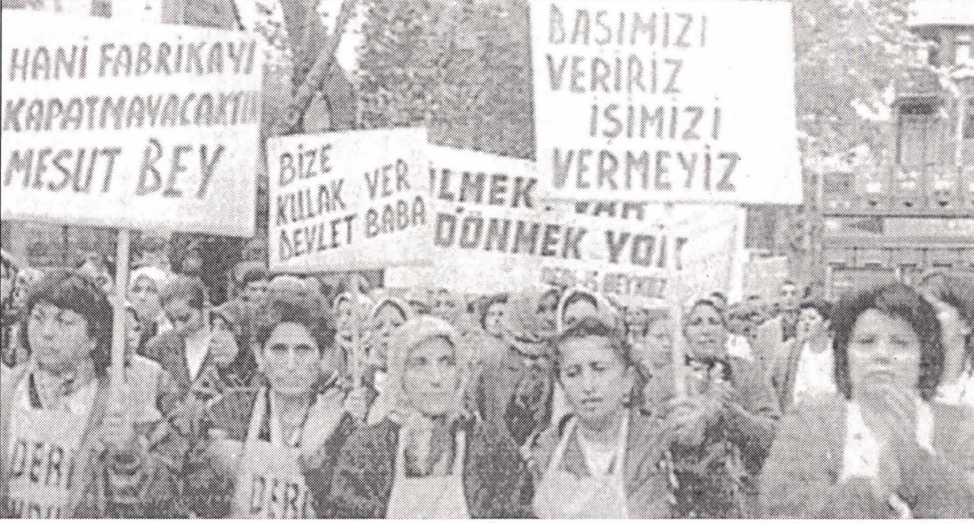
Beykoz Kundura'dan kadın işçiler fabrikalarının kapatılmasına karşı eylemler (1999)