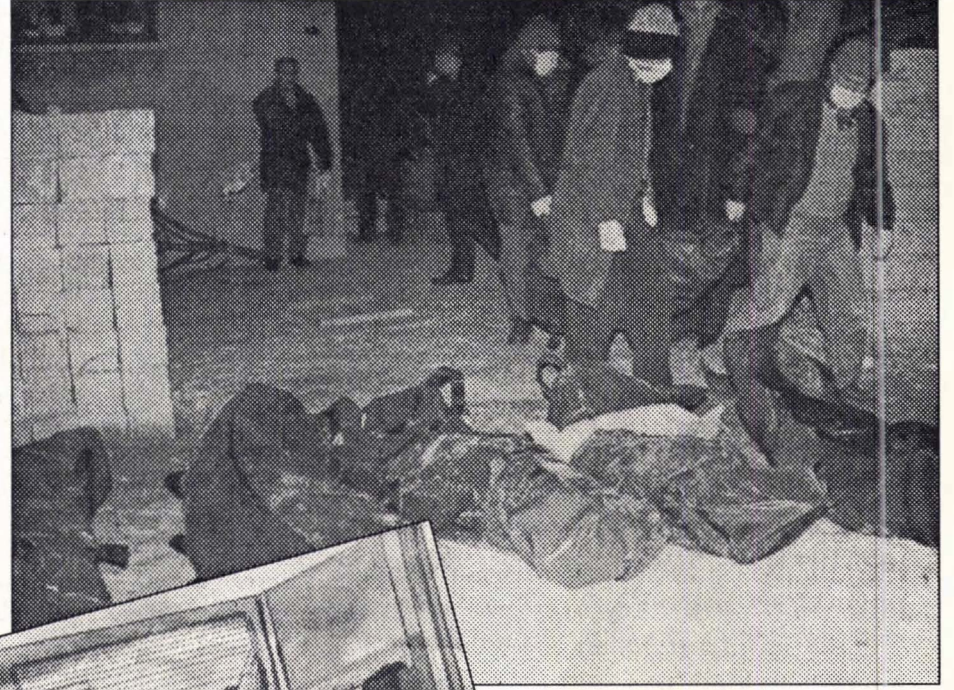
"Yeşil kuşak" ve Türk-islam sentezinden hizbi-kontra...