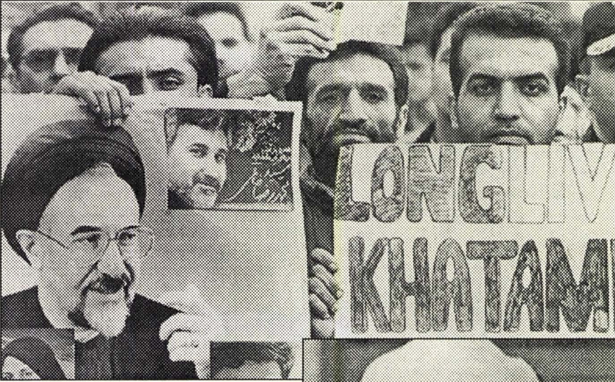
Mollalar rejimini ayakta tutan temel dayanaklar

Mollalar rejimini bugüne kadar ayakta tutan temel dayanaklar nelerdir? Herşeyden önce İran her bakımdan zengin bir ülkedir. Dünya petrol rezervlerinin %9'una sahip olan İran'ın dünya petrol üretimindeki payı %3'tür. Ama bu zenginlik asla halı-kilim sanayisi ve petrol kaynakları ile sınırlı olmayan bir ölçektir. Dahası, Afrika kıtasının birçok ülkesinin sahip olduğu potansiyel zenginlikler türünden de değildir. İran işletilen ve onyıllardır ülkeye harıl harıl döviz akıtan kaynaklara sahiptir. Dolayısıyla, bu maddi kudret en köhne bir rejimi bile yıllar boyu besleyebilecek ölçektir. Şah bu gelirin aslan payını emperyalist efendilerine peşkeş çekmekte ve kendi komisyonunu da Avrupa, Amerika bankalarına akıtmaktaydı. Mollalar rejimi ise bu maddi zenginliği onyıllardır kendisini ayakta tutmak için kullanmaktadır. İran toplumu sahip olduğu zenginlikleri işletebilecek sanayi altyapısına ve epeyce fire vermiş olsa da yetkin elemanlara sahiptir.