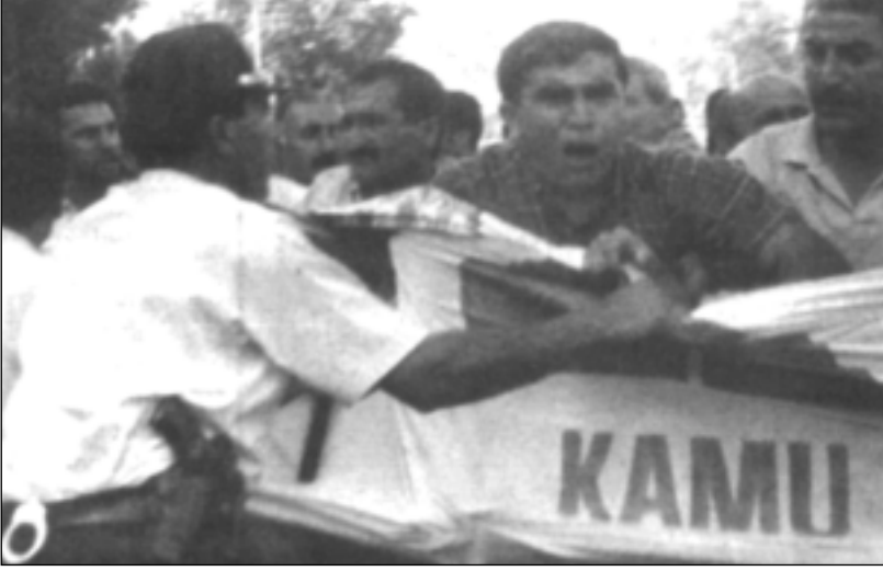
25 Haziran: Coşkulu başlayan eylem polis baskısıyla bitirildi!

25 Haziran günü, sahte sendika yasasının mecliste görüşüldüğü sırada, 250 kadar kamu emekçisi saat 18.30'da KESK Genel Merkez binası önünde toplanarak yürüyüşe geçti. Saraçhane Parkı'nda polis zayıf bir barikat kurmuştu. Emekçiler bu barikadı aşarak DSP Fatih İlçe Örgütü'nün önüne geldiler. Trafığı tek yönlü kapatıp, oturma eylemine başladılar.