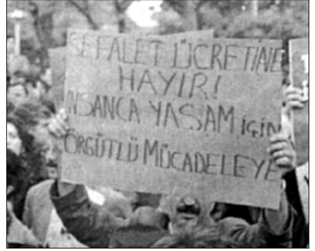
Türkiye'de asgari ücret diğer ülkelere göre çok düşüktür

çocukları da bir işe girmek ve aile bütçesine yardımcı olmak zorunda kalmaktadır. İlk bakışta bu toplumun proleterleşme düzeyini arttıran bir gelişme olarak olumlanabilir. Fakat bunun böyle anlaşılması için giderek genişleyen istihdam olanaklarının da mevcut olması gerekir. Fakat bugünkü koşullarda bu genel ücretler düzeyini daha da düşüren bir etken olmaktadır. İkinci bir kişinin çalışması ailenin yaşam koşullarının iyileşmesi anlamına gelmemektedir. Diğer bireylerin son derece düşük ücretlerle çalışması sayesinde ancak aile yaşamını sürdürebilmektedir. Bu işçi sınıfı için çürütücü bir kısır döngü anlamına gelmektedir.