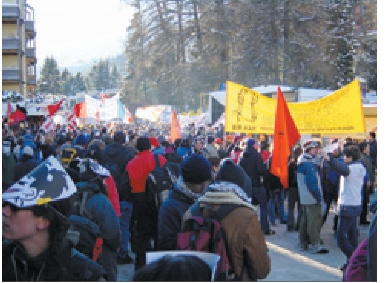
Basel'deki platform İsviçre İşçi Partisi (Neue PdA), TKİP ve Sosyalist Emek Hareketi bileşiminden oluşuyordu. Bu platform bir hafta önce Almanca ve Türkçe bir çağrı bildirisi dağıttı ve bildiri birçok

Davos'ta yapılacak Forum'u Forum karşıtları da yoğun bir hazırlıkla karşıladılar. Yapılacak olan protesto gösterilerinin hazırlığı 34 örgütün oluşturduğu "Olten Birliği" tarafında örgütlendi. Bunu hemen tüm büyük merkezlerde oluşan yerel platformlar tamamladı ve tüm hazırlıklar "Olten Birliği" ile koordineli bir şekilde yürütüldü.