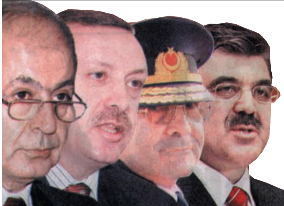
Uşaklığı üst boyutlara taşıma girişimleri

Uşaklık bununla da sınırlı değil. ABD emperyalizmi uçaklarının tipi, taşıdığı silahlar, uçuş irtifası vb. konusunda hiçbir yükümlülük altına girmede. Dolayısıyla nükleer, kimyasal ya da biyolojik silahlar da dahil istediği silahı Türkiye’nin hava sahasından geçirecek.