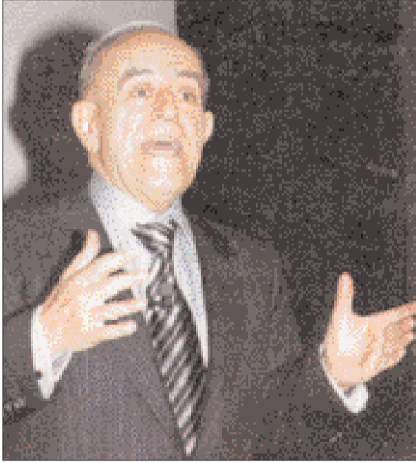
Kırıntılarla ödüllendirilen uşaklık

Elbette Türk devleti gibi, emperyalist savaşa destek vermiş, ABD-İngiltere saldırganlığının taşeronluğunu yapmış çakalların hesabı daha büyük. İspanya, Avustralya, İtalya, İsrail, Polonya... diye sıralanıp gidiyor bu grup. ABD bunları, yaptıkları ve yapacakları uşaklıklar karşılığında kırıntılarla ödüllendirmeyi vaadediyor. Irak'ın Yeniden İnşası ve İnsani Yardım Ofisi (ORHA) ve Amerikan Uluslararası Kalkınma Ajansı (USAID) çalışmalarını hızlandırmış durumdadır. Küçük ihaleler ve işler, yani kesinlikle büyük olmayan kırıntılar karşılığında kirli işleri yapacak gönüllüler arıyorlar.