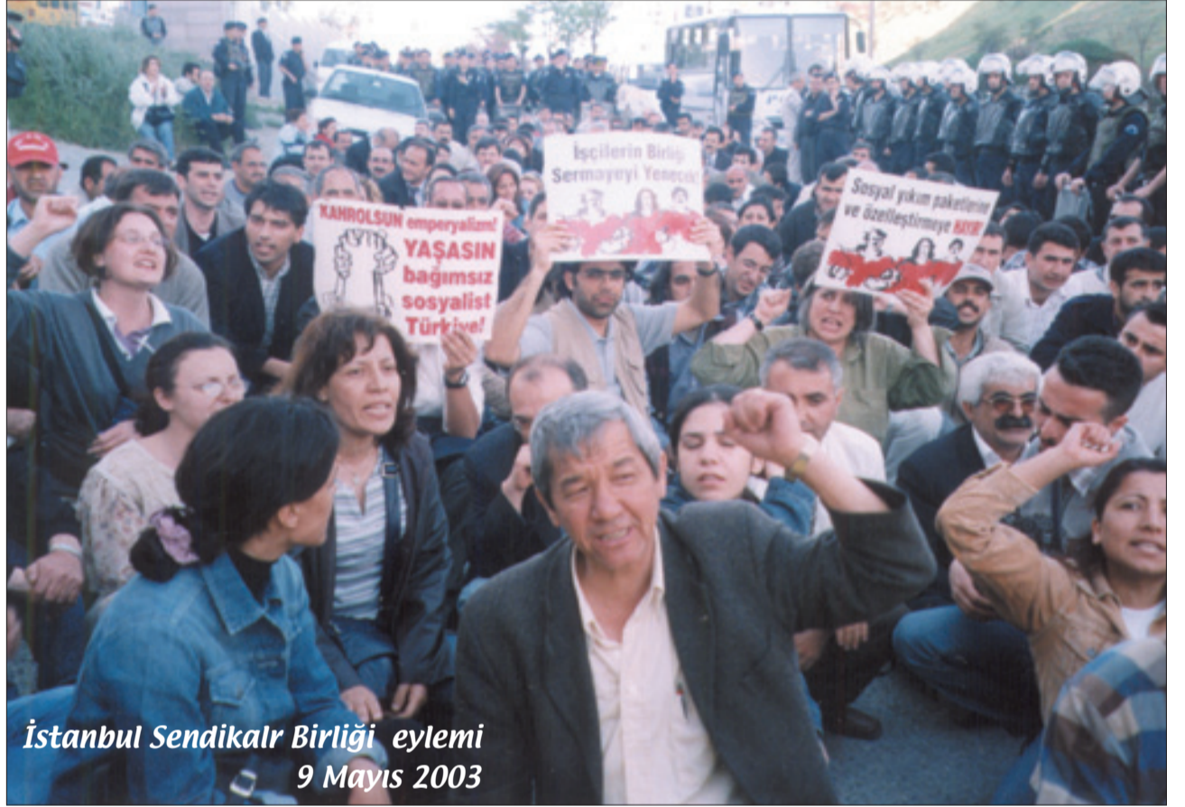
İstanbul Sendikalar Birliği eylemi 9 Mayıs 2003

"İş Güvencesi Yasası", üzerinde yürütülen birçok tartışma sonrası yasalaştı. Mevcut haliyle iş güvencesi sağlamayan yasa, yeni iş yasası ile birlikte tüm den-