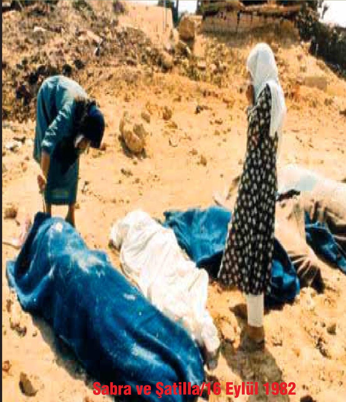
Sabra ve Şatilla/16 Eylül 1982