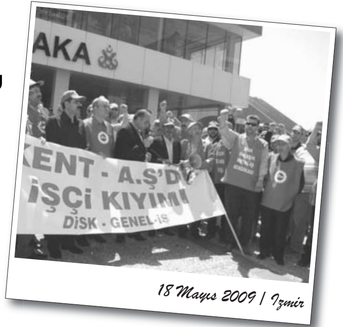
18 Mayıs 2009 / İzmir

Açıklama şu sözlerle sona erdi: “Sorunun çözümününün taşeronlar ve müteahhit firmalarda aranması ve bunun çözüm gibi gösterilmeye çalışılması devam ettiği müddetçe direnişimiz ve mücadelemiz artarak devam edecektir. Bu haklı talebimizi işimize dönene kadar sürdüreceğiz. Atılan işçilerin eşleri ve çocukları adına sesleniyoruz. Bu sosyal cinayeti sonlandırın. Tüm girişimlerin sonuçlanmaması durumunda yaşanacak her türlü