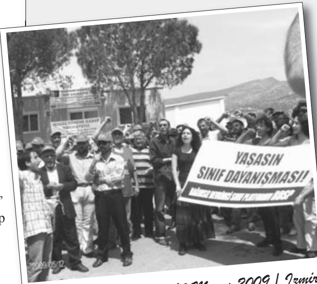
16 Mayıs 2009 / İzmir

İzmir Karşıyaka Belediyesi'ne bağlı Kent A.Ş.'de çalışan DİSK / Genel-İş üyesi işçilerin direnişi Örnekköy Şantiyesi'nde devam ederken, direnişçi işçilere İzmir Bağımsız Devrimci Sınıf Platformu (BDSP) tarafından dayanışma ziyareti gerçekleştirildi.