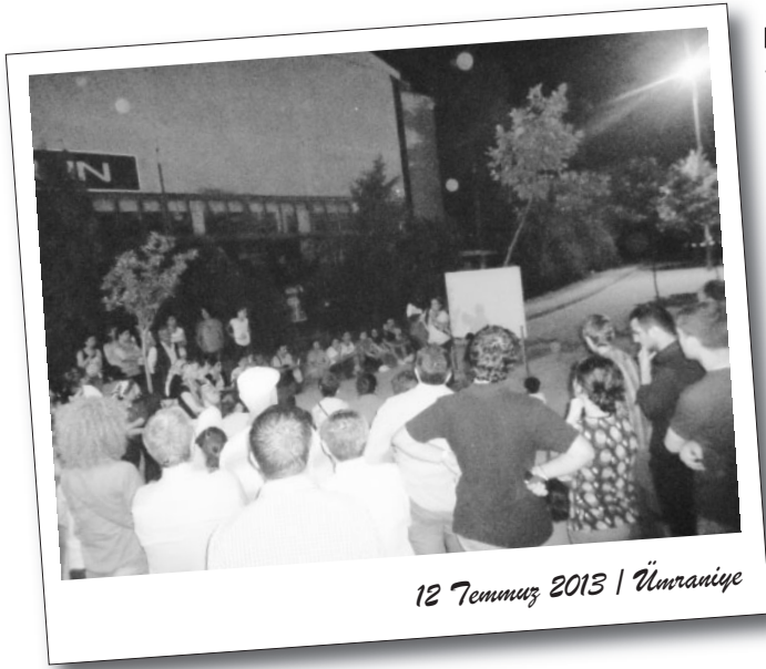
12 Temmuz 2013 | Ümraniye

gerçekleştirilen eylem, etkinlikler, kazanımlardan bahsedildi. Daha sonra söz mahalle sakinlerine bırakıldı. Mahalledeki çöp sorunundan, Aile Hekimliği'nin özelleşmesine, Gezi Parkı Direnişi nedeniyle tutuklananlarla dayanışmaya, seçimlere, AKP'nin gitmesinden, AKP-CHP-MHP bütün partilerin aynı düzeni temsil ettiği bu nedenle birbirlerinden farklı olmadıklarına ve ufumuzun devrim olması gerektiğine kadar pek çok görüş dile getirildi.