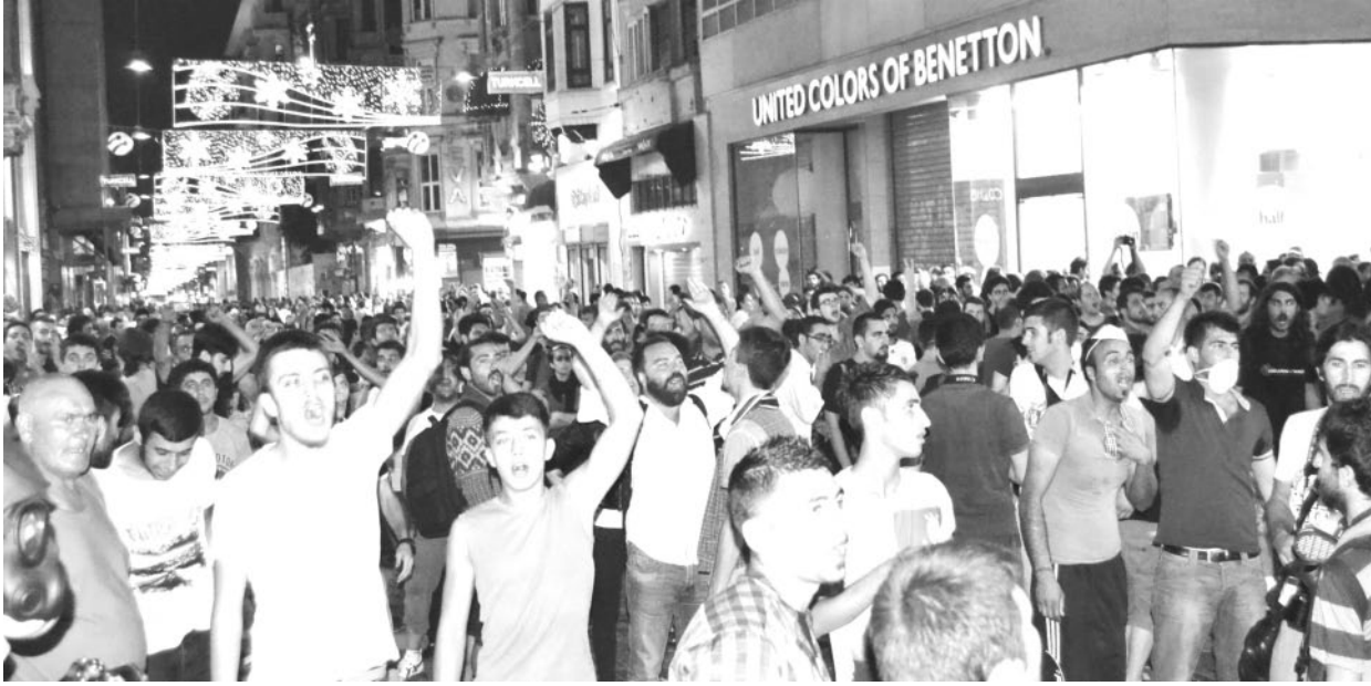
Yeni kent savaşları

Kent, tarih boyunca sınıflar mücadelesinin en keskin yaşandığı, ve bu mücadelenin en sert seyrettiği coğrafya oldu. En başta işçi sınıfının ana rahmi olan kentler, sınıf mücadelesinde de taşıyıcı roller üstlendi.