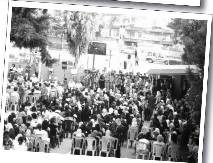
13 Temmuz 2013 | Antakya

verecek!/Sarıgazi halkı" pankartı arkasında Vatan İlk Öğretim Okulu önünden Sarıgazi merkezine yürüdü. Merkeze gelindiğinde ise direnişte hayatını kaybedenler için saygı duruşu gerçekleştirilip Taksim Direnişi ile ilgili sinevizyon gösterisi yapıldı. Ardından forum düzenlendi.