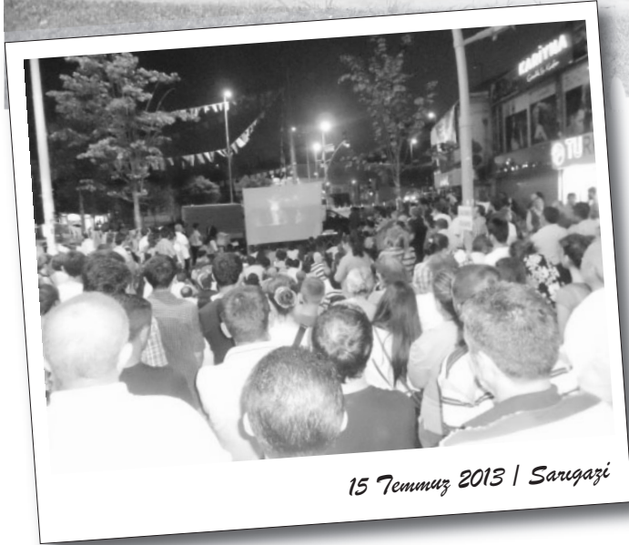
15 Temmuz 2013 | Sarıgazi

Taksim Direnişi'nin yarattığı hareket kendini yeni mücadelelere forumlarda mayalıyor. Başta direnişin kalbi İstanbul olmak üzere, mücadeleye dair tartışması olan tüm alanlarda forumlar özgür kürsüler oluyor.