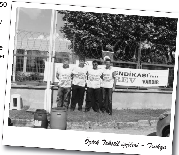
Özbek Tekstil işçileri - Trakya