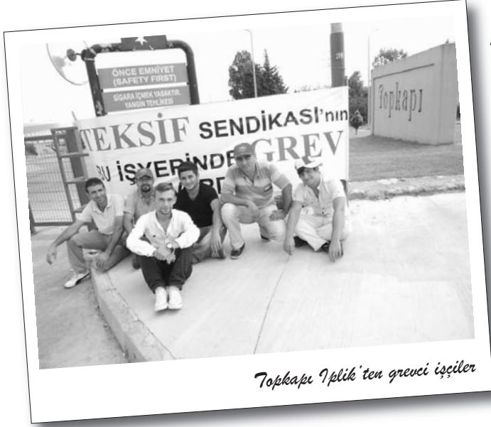
Topkapı İplik'ten grevci işçiler

Tekstilde patron sendikası ve TEKSİF'in yürüttüğü toplu sözleşmede anlaşma sağlanamaması üzerine başlayan grev büyüyerek sürüyor.