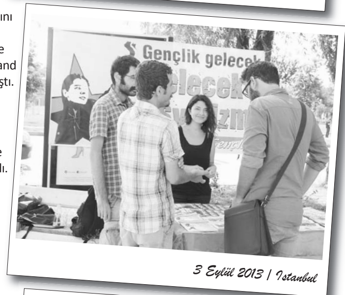
3 Eylül 2013 | İstanbul