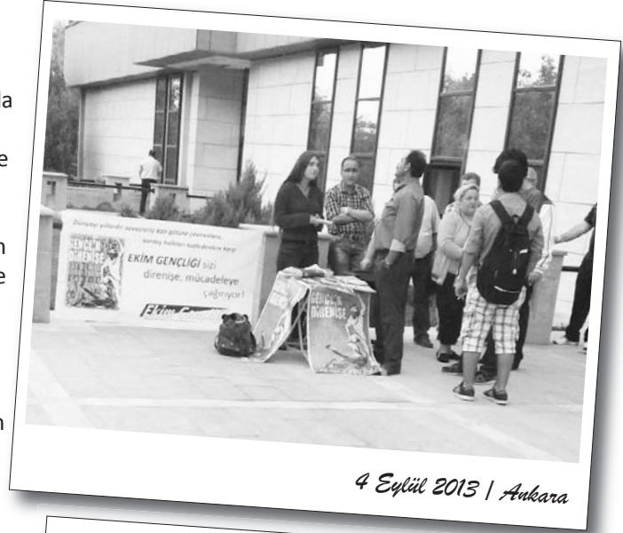
4 Eylül 2013 | Ankara

Dağıtımlarına devam eden öğrencilere çevreden de devrimci öğrenciler destek verdi.