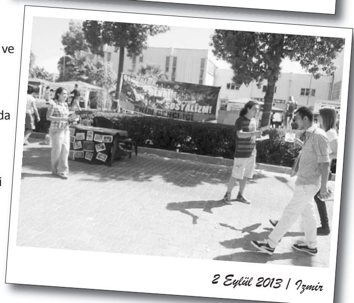
2 Eylül 2013 | İzmir

ÖGB'lerin saldırması ile standlar dağıtılırken orada olan TKP'li öğrenciler ve Gençlik Muhalefeti olayı seyretmekle yetindiler. Bu çevreler sabah gelip stand açmak istemişler fakat okul yönetimi izin vermeyince standlarını kaldırmışlardır. Nitekim bu durum okul yönetimim tarafından devrimci öğrencilere karşı kullanılmıştır.