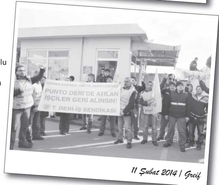
11 Şubat 2014 | Greif