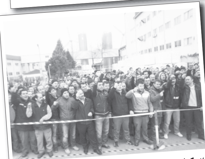
12 Şubat 2014 | Greif