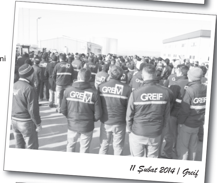
11 Şubat 2014 | Greif