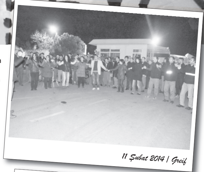
11 Şubat 2014 | Greif

Greif işçilerinin mücadelesini tanımayan ihanetçi sendika patronlarını kendilerinin de tanımadığı belirtilerek DİSK ve bağlı sendikalara mücadeleyi sahiplenme çağrısı yapıldı. Açıklama "Zafer bizim olacak. Zafer tüm işçi sınıfının olacak." sözleri ile noktalandı.