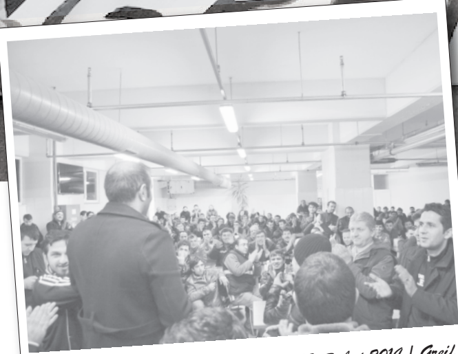
12 Şubat 2014 | Greif