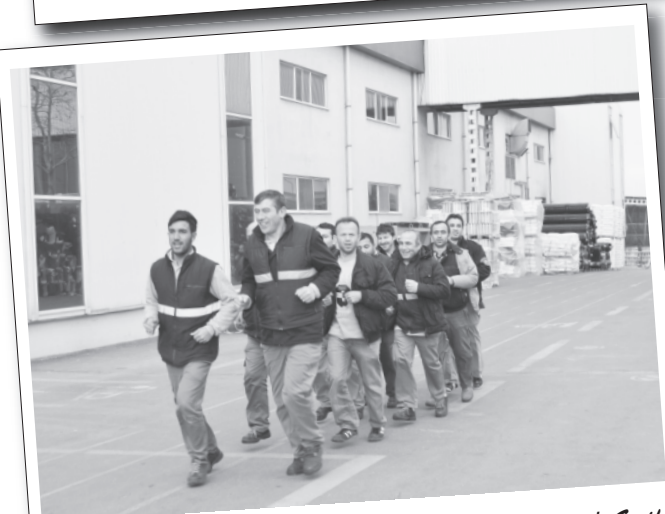
12 Şubat 2014 | Greif