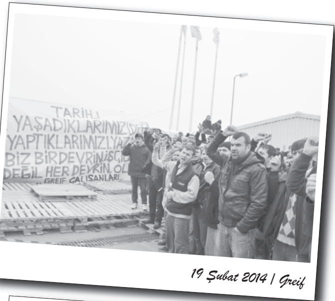
19 Şubat 2014 | Greif

Sultanbeyli'deki taşeron işçileri bahçenin iç kısmında kapının yanına gelerek konuşmaları ve sloganları alkışlarla karşıladılar. Zaman zaman içerideki işçilerden sloganlara katılanlar oldu. Bekleme devam ederken genç bir işçi kapı üzerinden atlayarak dışarıdaki Greif işçilerinin yanına geçti. Ardından işgalci işçilerden bir kısmı Sultanbeyli fabrikasından kapısından atlayarak bahçe içerisine işçilerin yanına geçti. İşçilerle konuşmalar yapılarak, üretimi durdurma çağrısı yapıldı. Yarım saat boyunca işbaşı