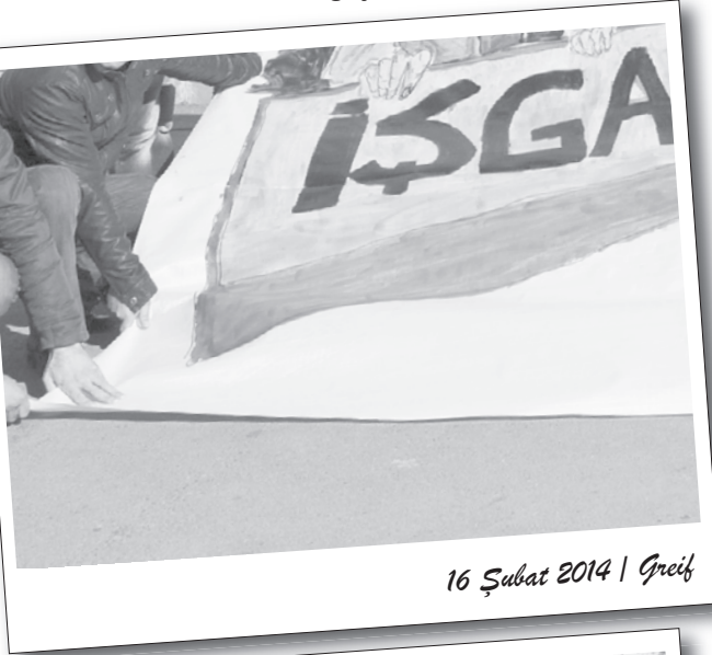
16 Şubat 2014 | Greif

İşgalci işçiler, patron ve sendikanın yeni saldırı adımlarına karşı, Greif'in Samandıra ve Dudullu fabrikalarına giderek, oradaki işçileri mücadeleye ortak olmaya çağırıyordu. Sultanbeyli'deki işçilerin çıkış saatinden önce, patron tarafından çıkarılması nedeniyle Greif'in oradaki fabrikasına gidilemedi. Fabrikaların ardından, Şişli'de yapılan yürüyüşle DİSK Genel Merkez binasına geçildi.