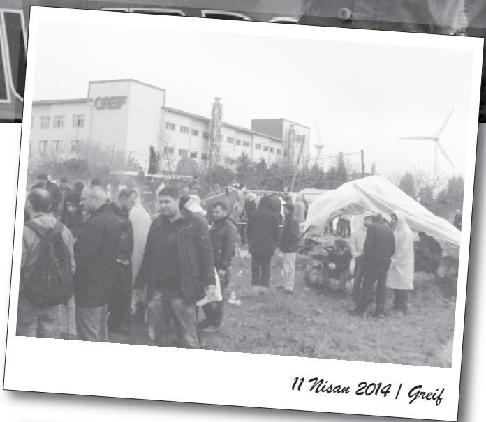
11 Nisan 2014 | Greif

Greif işçileri Grup Yorum konserine katıldılar. Direnişçi işçiler pankartlarıyla alanda