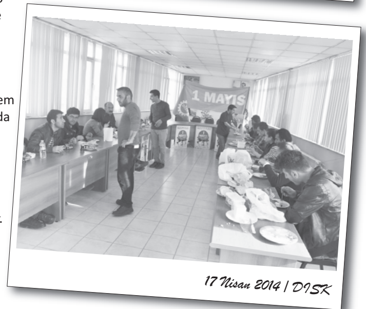
17 Nisan 2014 | DİSK