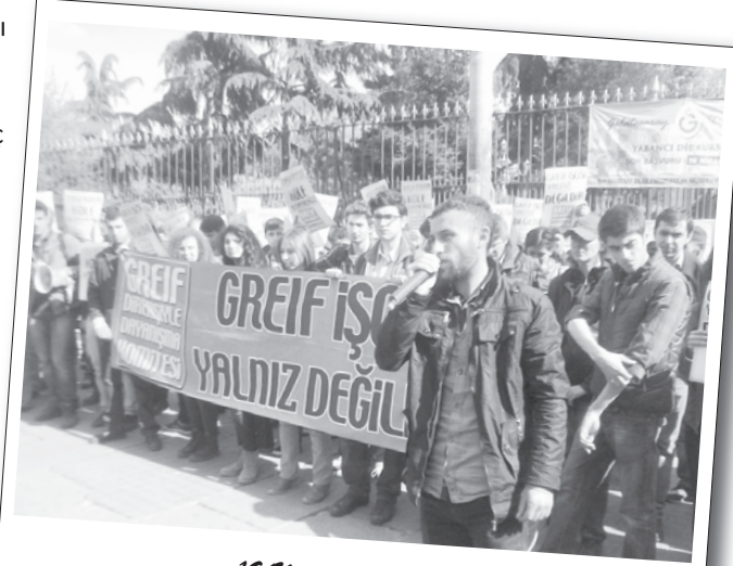
19 Nisan 2014 | Galatasaray Lisesi önü

Ancak işçiler ihanet çetesiyle konuşacakları birşeyleri olmadıklarını, toplantı yapmayacaklarını