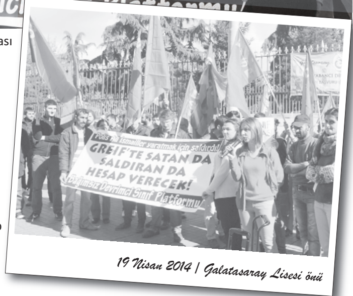
19 Nisan 2014 | Galatasaray Lisesi önü