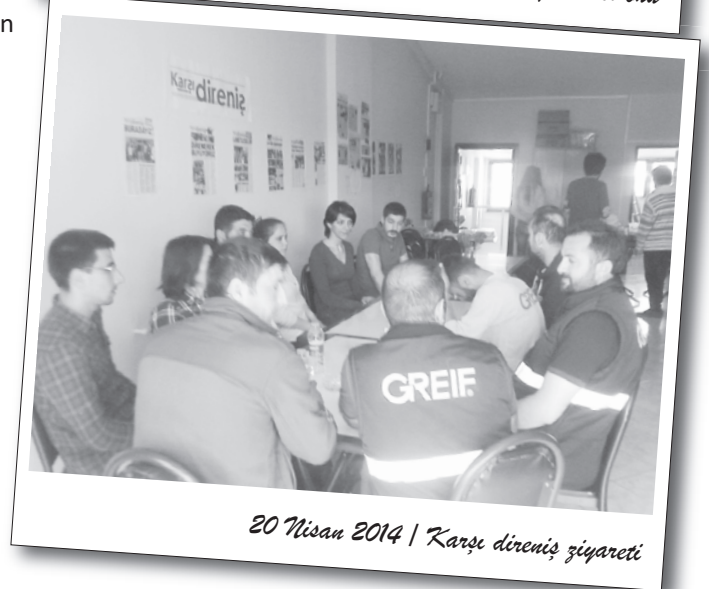
20 Nisan 2014 | Karşı direniş ziyareti