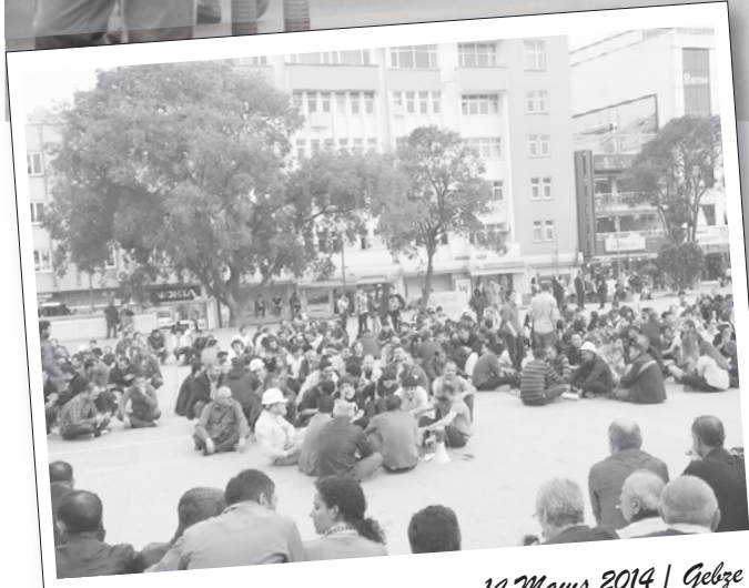
14 Mayıs 2014 | Gebze