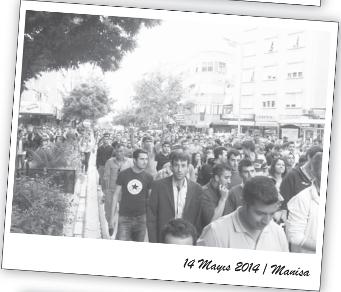
14 Mayıs 2014 | Manisa