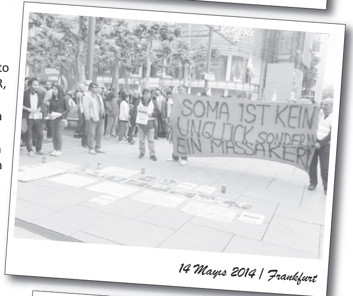
14 Mayıs 2014 | Frankfurt