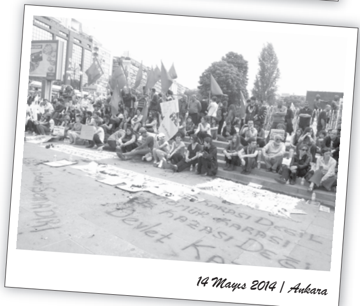
14 Mayıs 2014 | Ankara