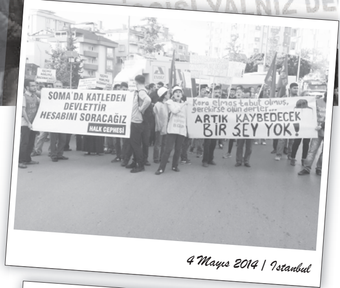
4 Mayıs 2014 | İstanbul

Yatağan işçileri, Cebeci, DTCF ve Hacettepe’den gelen öğrenciler barikatları aşarak