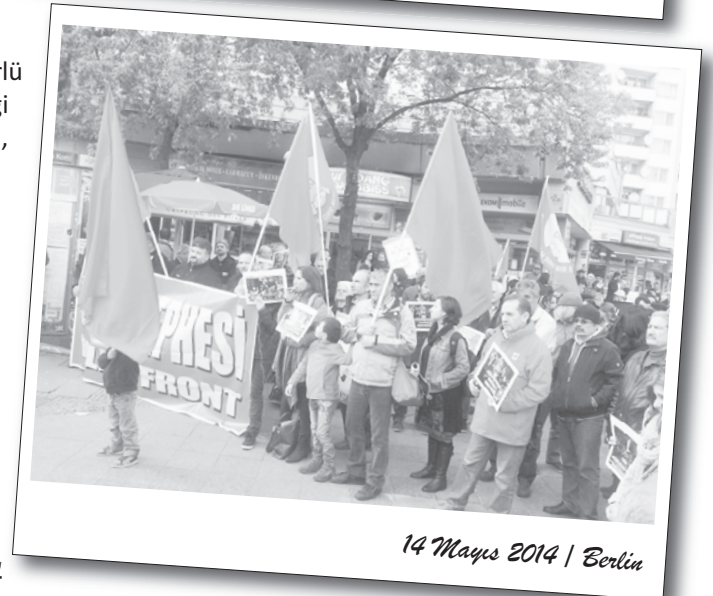
14 Mayıs 2014 | Berlin