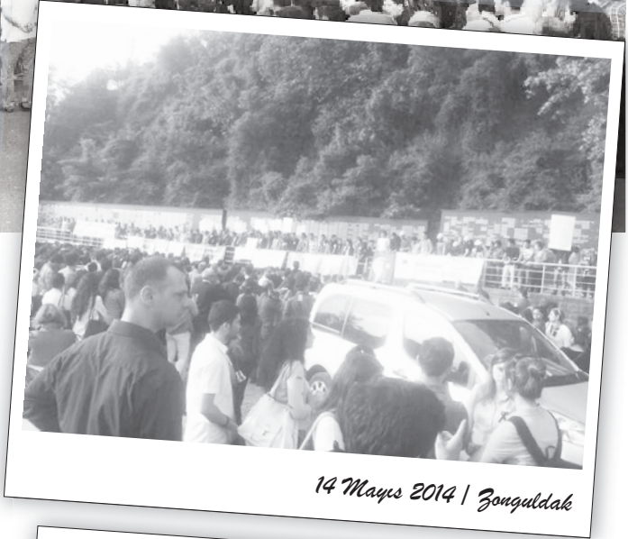
14 Mayıs 2014 | Zonguldak

KESK sözcüsünün okuduğu basın açıklamasında katliamın göz göre göre yapıldığı, taşeronlaştırmaya karşı AKP'den hesap sormak için alanlarda olunması gerektiği vurgulandı. Öfkeli sloganlarla bitirilen basın açıklaması sonunda oturma eylemi yapıldı. Oturma eylemi sırasında şiirler okundu, marşlar söylendi.