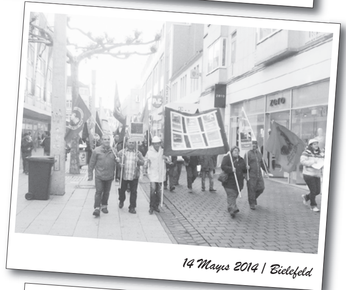
14 Mayıs 2014 | Bielefeld