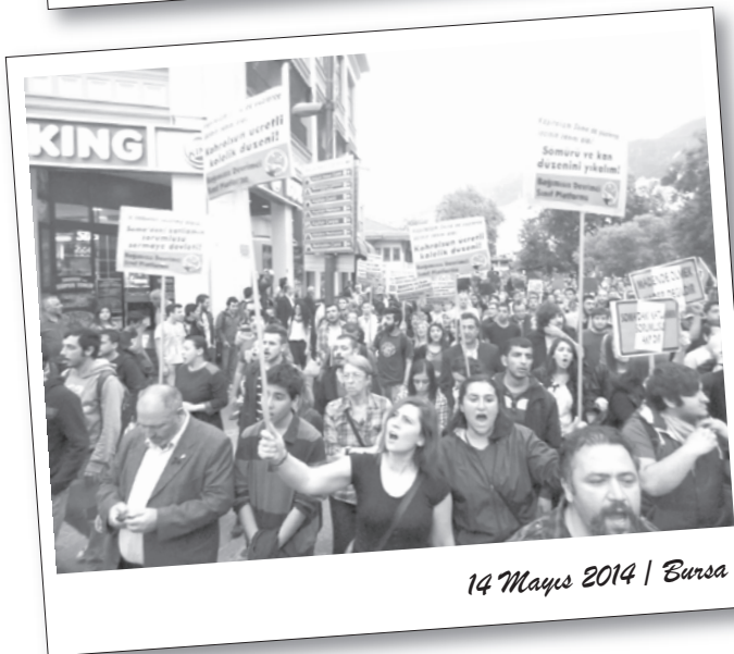
14 Mayıs 2014 | Bursa