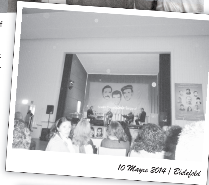
10 Mayıs 2014 | Bielefeld