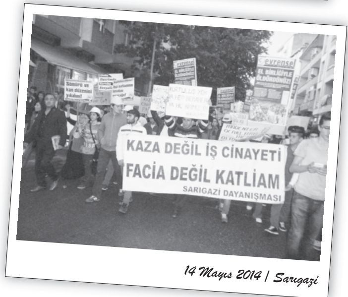
14 Mayıs 2014 | Sarıgazi