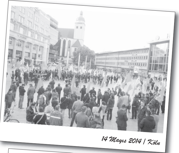
14 Mayıs 2014 | Köln