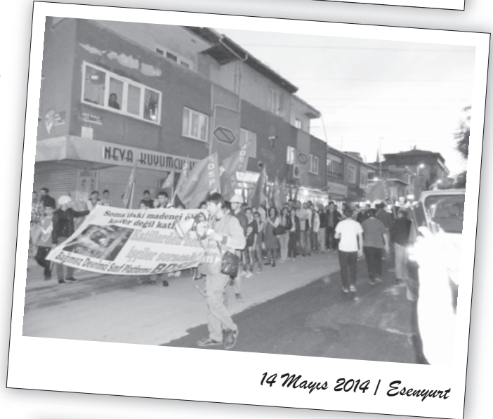
14 Mayıs 2014 | Esenşehir