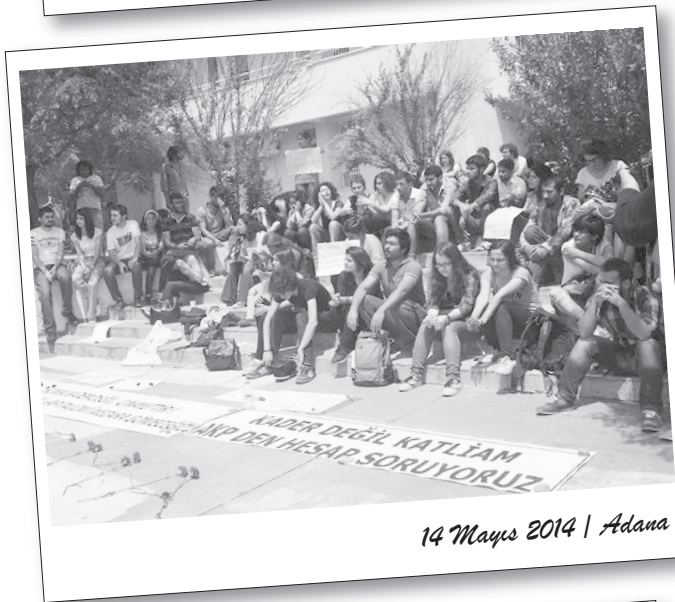
14 Mayıs 2014 | Adana