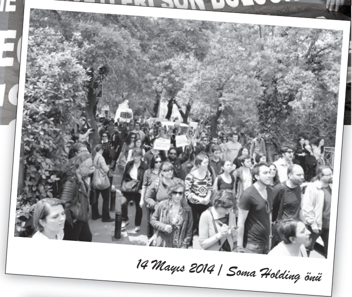
14 Mayıs 2014 | Soma Holding önü

BDSP, Esenyurt Depo Kapalı Cadde'de gerçekleştirdiği yürüyüşle Manisa Soma'da yaşanan toplu işçi katliamını protesto etti. Yürüyüş saat 20.00'de Kapalı Cadde girişinden başladı.