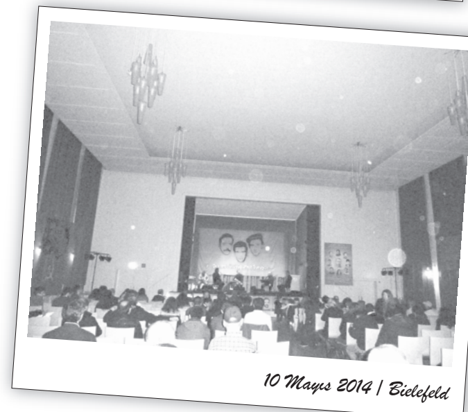
10 Mayıs 2014 | Bielefeld