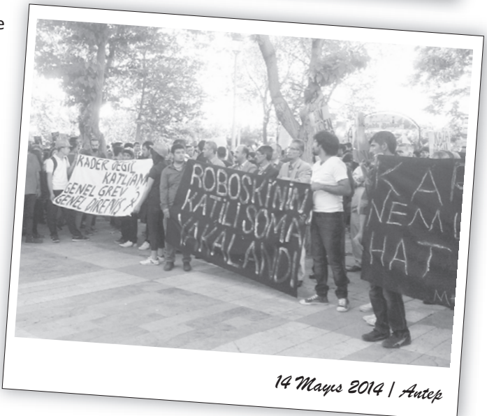
14 Mayıs 2014 | Antep