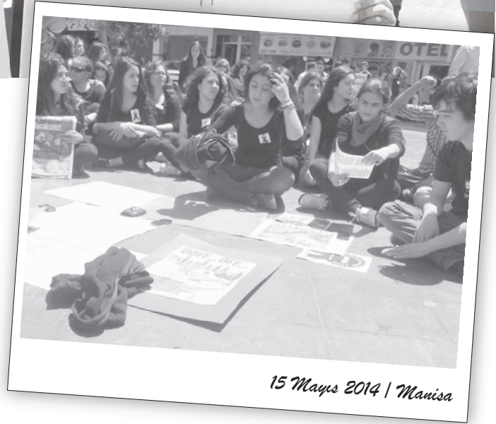
15 Mayıs 2014 | Manisa

Manolya Meydanı'ndan başlayan yürüyüş eski adalet sarayının bulunduğu caddeden devam ederek