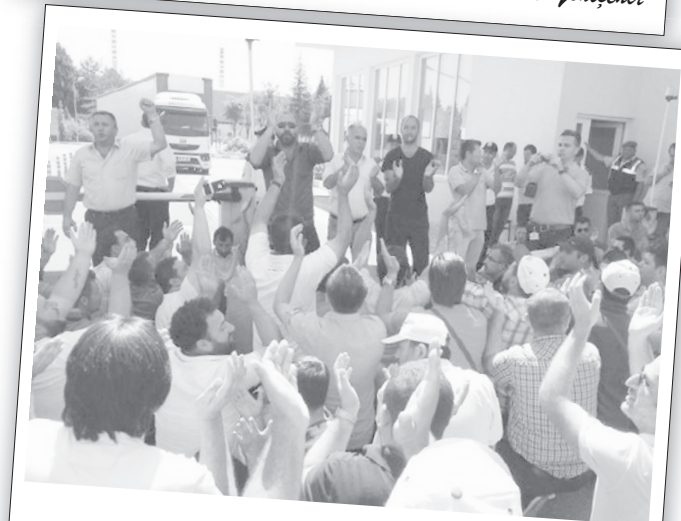
25 Haziran 2014 | Kırklareli

direniş!" sloganları ile grev alanına geldi. Grevdeki işçiler alkışlarla ve "Yaşasın sınıf dayanışması!" sloganı ile karşıladılar. İşçilerle grev üzerine uzun sohbetler edildi.