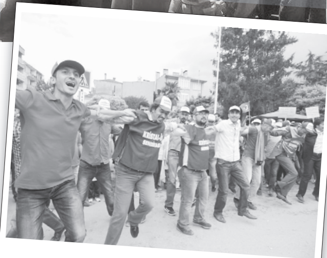
20 Haziran 2014 | Yenişehir

Bağımsız Devrimci Sınıf Platformu da Şişecam işçilerini ziyaret etti. BDSP'liler "Şişecam işçisi yalnız değildir!", "Zafer direnen işçilerin olacak!", "İşgal, grev,