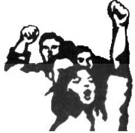
DGB: Gençlik içerisinde devrimci bir odak

Sınıf devrimciliğinin gençlik içerisindeki temsilcisi olan Ekim Gençliği bu iddiaya uygun olarak örgütlenmeye, gençliğin sınıfın devrimci partisina, devrim ve sosyalizm mücadelesine kazanmaya devam edecektir. Tam da bu noktada esnek bir kitle örgütlenmesi olarak Devrimci Gençlik Birliği, Ekim Gençliği'nin hedefine ulaşmasında önemli imkanlar yaratacak bir araç olacaktır.