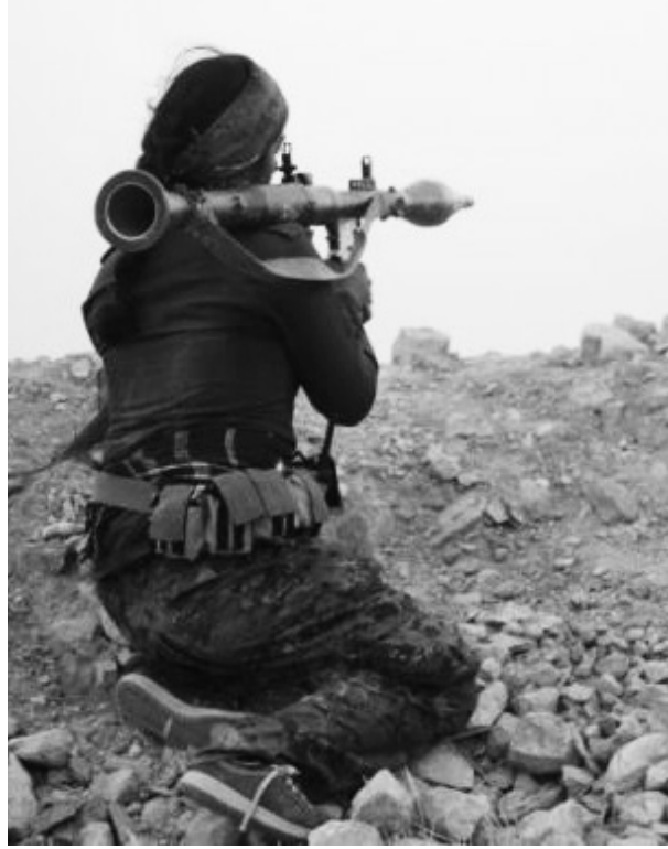
Bu direnişe, Kobanê Kantonu yöneticileri de silahlanıp mevzilerde yerlerini alarak katılım sağladılar.

Kürt halkı ve ülkenin dört bir yanından Suruç'a gelen binlerin Kobanê'yle dayanışmayı yükseltmesine tahammül edemeyen Türk sermaye devleti, sınır hattındaki bekleyişe gaz bombaları ve plastik mermilerle günlerce saldırdı.