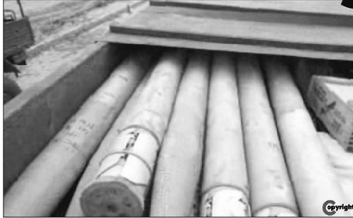
MİT TIR'larının içinde yapılan çekimlerde, kutulardaki silahların ve mühimmatın seri numaraları açığa görünüyor.

Üç TIR'da yapılan aramalarda toplam 1000 adet 100 mm'lik top ile 50 bin adet makineli tüfek, 30 bin adet ağır makineli tüfek ve 1000 adet havan mühimmatı mermisi bulunmuştu. Gazete, savcılık