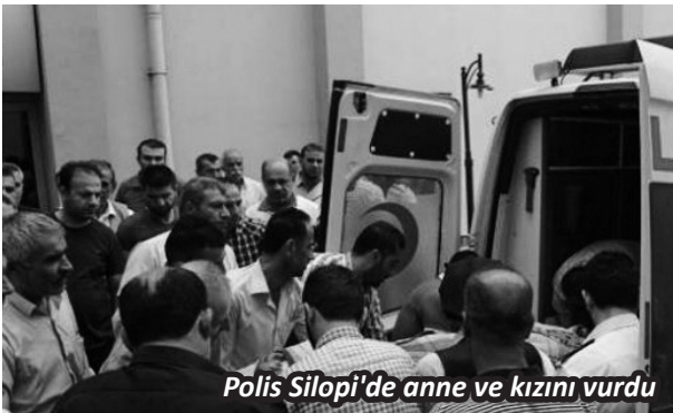
Polis Silopi'de anne ve kızını vurdu