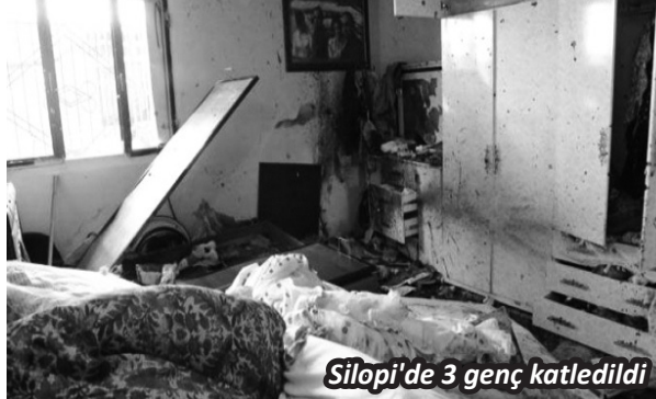
Silopi'de 3 genç katledildi