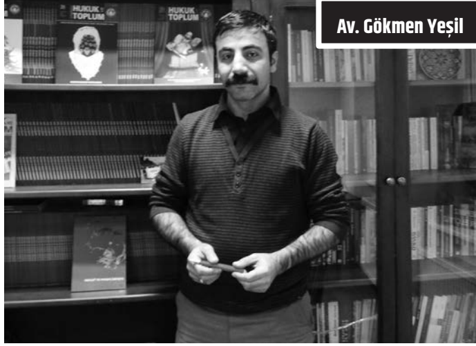
Av. Gökmen Yeşil

ÇHD ve ÖHD'nin de aralarında bulunduğu avukat örgütlerine yönelik saldırılara ilişkin "Bugün Türkiye'de çok önemli bir işlev gören baroların dahi işlevleri-