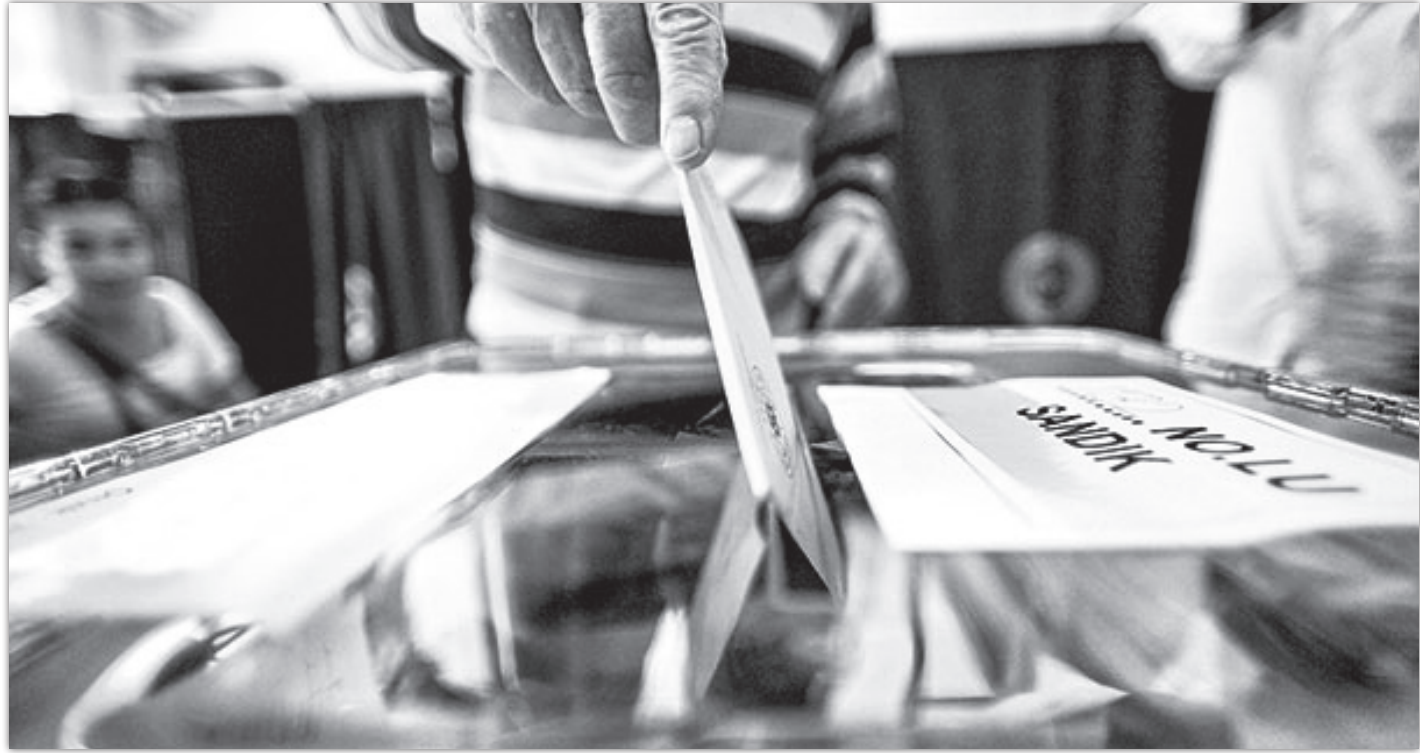
formların hayata geçirilmesi."

- Enerji sektöründe serbest, sürdürülebilir ve öngörülebilir piyasa hedefli re-